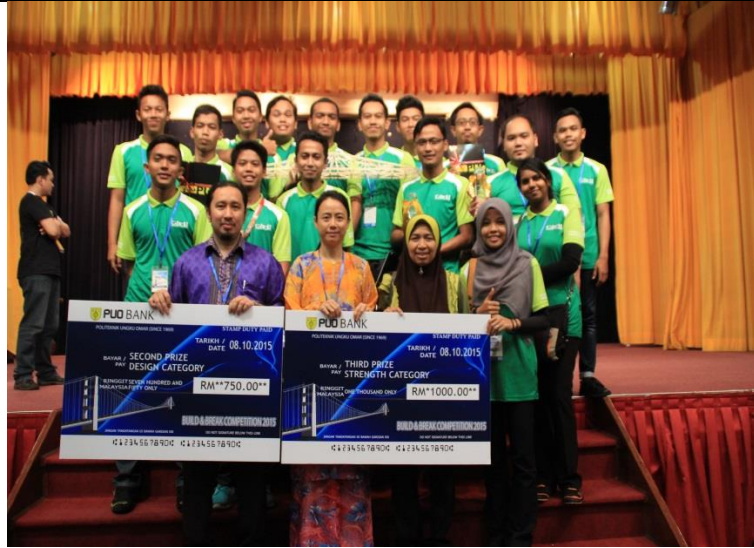
Gambar 8: Keseluruhan Team PSIS