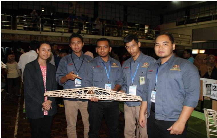
Gambar 4: Ahli Kumpulan Inspiring PSIS