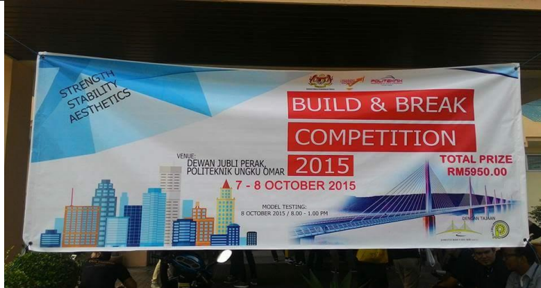
Gambar 1: Banner pertandingan