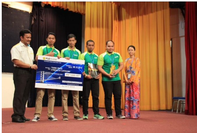
Gambar 7: Tempat Ketiga Kategori Strength – Pioneering PSIS