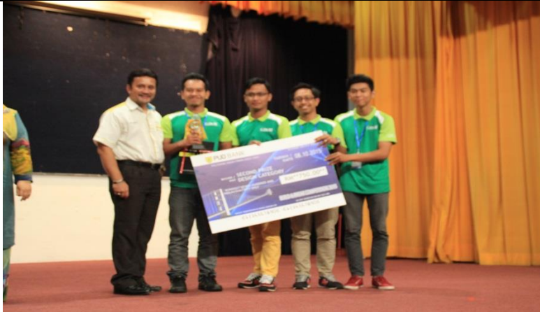
Gambar 6: Naib Johan Kategori Design – Synergy PSIS