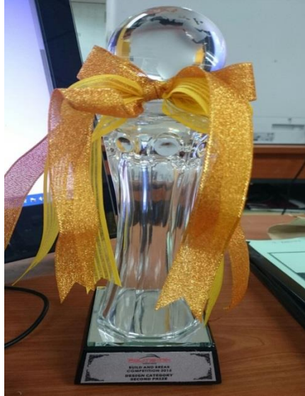
Gambar 10: Trofi kemenangan “Kedua Design Category”