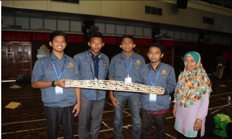
Gambar 3: Ahli Kumpulan Sustainable PSIS