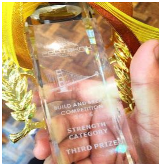
Gambar 9: Trofi kemenangan “Ketiga Strength Category”