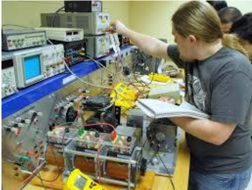
Foto pelajar beraksi dalam situasi Pembelajaran TVET, seperti di Makmal, Bengkel, Studio, atau lain-lain suasana yang sesuai dengan program, , sebagai contoh -