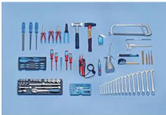
Foto dan peralatan yang digunakan oleh TVET. Imej peralatan sahaja, sebagai contoh –