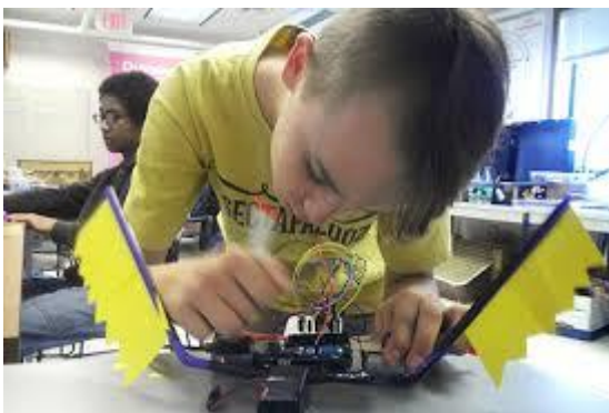
Foto kanak-kanak berumur antara 5-10 tahun beraksi menggunakan peralatan TVET, sebagai contoh –